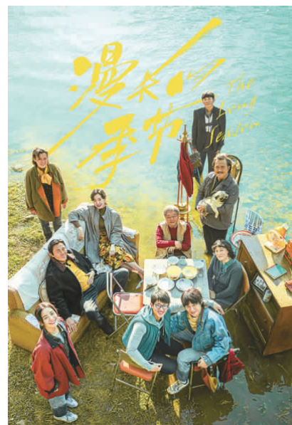
网络剧《漫长的季节》海报。