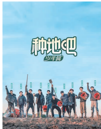
网络综艺节目《种地吧》海报。