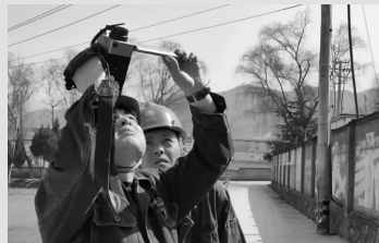
3月16日,甘肃陇南成县供电公司员工为10千伏店红线001号杆上设备测温。