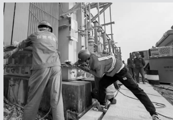
3月16日,四川自贡供电公司员工在贡井区35千伏五宝变电站安装新的1号主变压器。