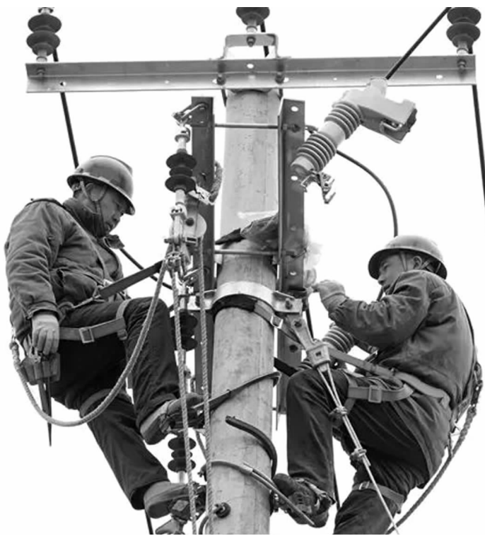
3月17日,山东临沂费县供电公司员工王法尊、夏见亮在10千伏石岚线大良支线03号杆安装跌落式熔断器。