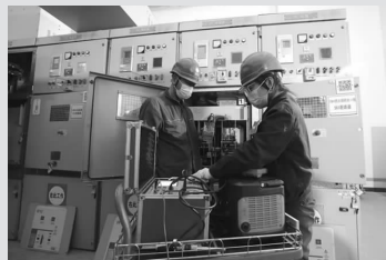
3月16日,河北保定供电公司员工在220千伏崔闸变电站内检修10千伏间隔。