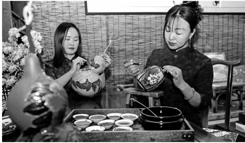
1月14日，在襄汾县景毛乡景毛村的子羽葫芦工作室里，手艺人正在用传统技艺制作子羽葫芦画系列作品。李现俊 摄