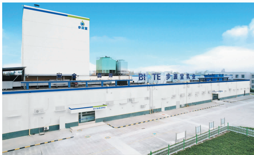
位于陕西杨凌的步源堂乳业