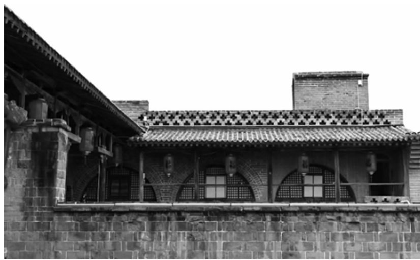
百年古村方山县张家塔村。 资料图片

周围雄伟的山峰给游客带来强烈的视觉冲击,大家纷纷在此打卡拍照,热闹的场景让冬日的山村保持着一份蓬勃的活力。