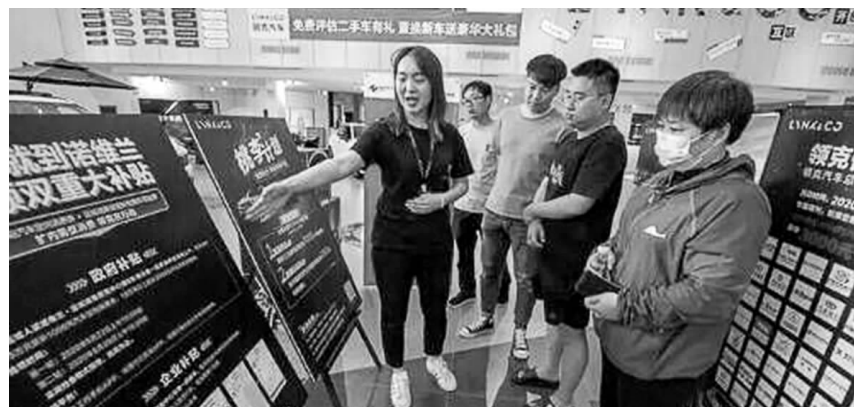
山西诺维兰(集团)有限公司。 资料图片

在编制中,山西省工商联注重顶层设计和统筹协调,将《山西省民营企业社会责任报告(2023)》作为年度重点工作,推动《报告》各项工作顺利开展;发挥工商联“联”字优势,凝聚各方力量,连续6年发布民营企业社会责任年度报告,创新开展“民营企业社会责任领先企业”评价工作,连续举办社会责任示范培训,持续促进民营企业深化社会责任理念;注重典型示范引领,推选7家企业入选《中国民营企业社会责任优秀案例》,98家(次)企业入选山西省民营企业社会责任年度报