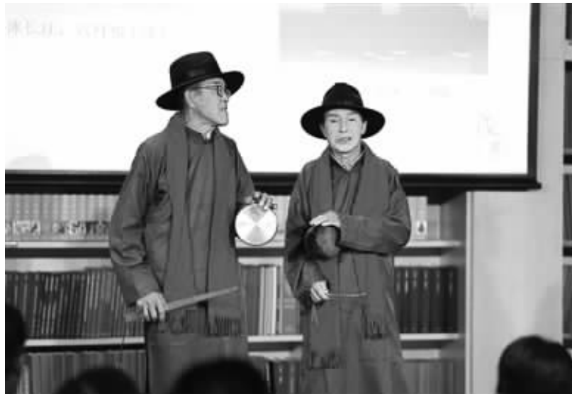
民间艺人表演高淳民歌。

原生态民歌是中华文化的活化石。中国民歌资源丰富,不同地域形成了不同风格的民歌文化。近日,来自湖南和江苏的两场民歌讲唱会先后在北京国家大剧院举办,为观众导赏了极具地域特色的桑植民歌、高淳民歌,一展溇澧大地和苏南地区的民歌风情。