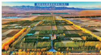
国家地理标志农产品(特色)