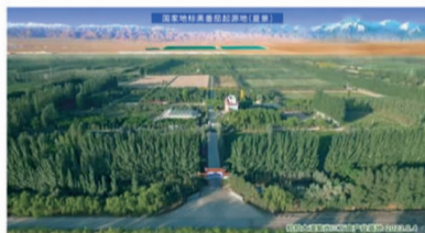
国家地理标志农产品(黑番茄)