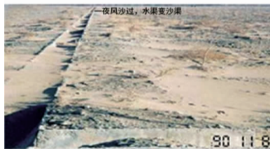
一夜风沙过，水果变沙漠