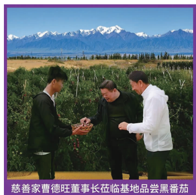
慈善家曹德旺董事长莅临基地品尝黑番茄