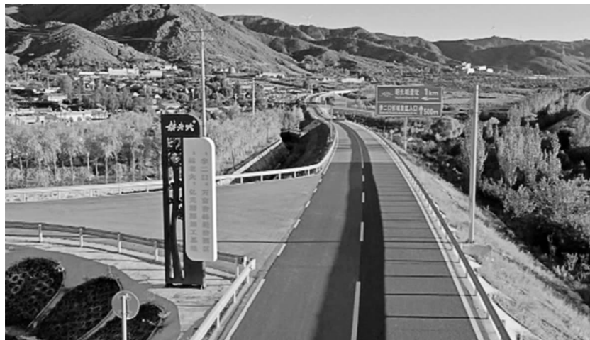
太行一号旅游公路。 资料图片

流降本提质增效取得显著成效,社会物流总费用与国内生产总值的比率力争降低至13.5%左右。